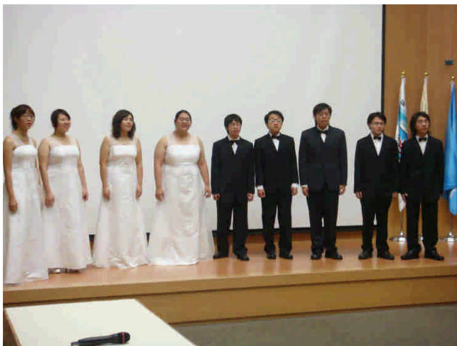
【杏聲合唱團於誠樸廳為來賓獻唱天黑黑與月亮代表我的心】